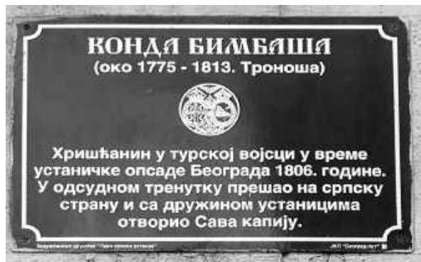
Tabla u Kondinoj ulici u Beogradu

No, krenimo redom. Pre nekih desetak godina, tadašnji gradski oci u užem gradskom jezgru ispod naziva ulica postavili su i natpise koji prolaznicima daju osnovne podatke o ličnosti po kojoj je kaldrma dobila ime. Ove table prijatnog izgleda, za razliku od dvojezičnih putokaza čija je očigledna namena da turiste i strance upoznaju sa gradskim spomenicima kulture, imaju samo ćirilični tekst te se, dakle, nude prevashodno na polzu i prosvetljenje lokalnom stanovništvu. Tako je, pored ostalih, i Kondina ulica dobila natpis sledeće sadržine: