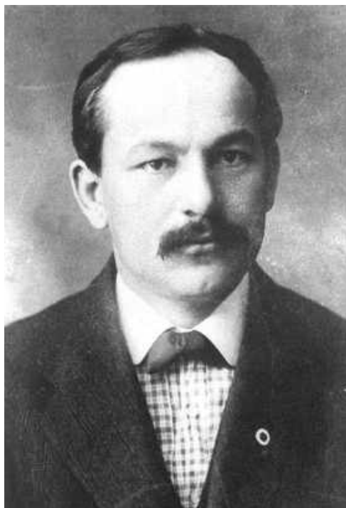
Dimitrije Tucović (1881-1914)

Niz kasnijih izvora potvrđuje ovu lokalnu tradiciju. Sredinom XIX veka, austrijski konzul u Skadru, Johanes Han, zabeležio je među Albancima tradiciju o šestorici braće kao rodonačelnicima plemena Piperi, Kuči, Hoti, Bonkeći, Vasojevići i Krasnići, od koji