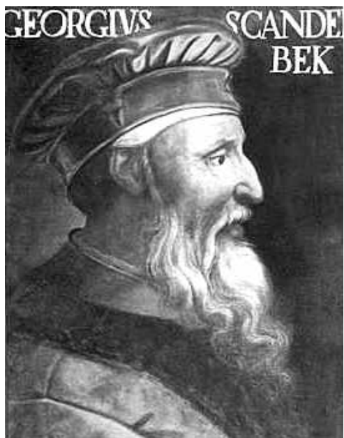
Đurađ Kastriot Skenderbeg (1405-1468)

što je zabeleženo u jednoj povelji koja se i danas čuva u manastiru. Godine 1430, Ivan Kastriot je sa svoja tri sina sklopio ugovor sa manastirom Hilandar, po kome mu je ustupljen jedan pirg (kula), koji od tada do danas nosi naziv „Arbanaški pirg“. Povelja o poklonu počinje sledećom rečenicom: „Po neizrecivom milosrđu vladike moga Hrista, ja, grešni i nedostojni, ne smem se nazvati rob Hrista Boga moga, Ivan Kastriot, sa mojim sinovima Stanišom i Repošem, Konstantinom i Đurđem, potrudih se, po gospodinu Bogu mome svedržitelju i pomoću gospođe Bogorodice Lavri Hilendarskoj...“. Ivanov sin Repoš je, 1431. godine, umro u manastiru Hilandar, gde mu se i danas može videti grob. Pretpostavlja se da je i sam Ivan Kastriot sahranjen u Hilandaru.