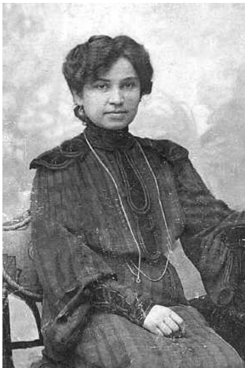
Jelisaveta Načić (1878-1955)