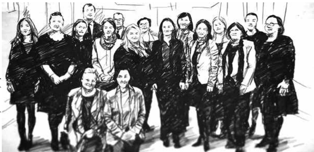
Učesnice inicijative "Sledite nas"

etničke distance i većem razumevanju. Poslanica kosovske skupštine, Teuta Sahatqia ( Teuta Sahatqia ), ističe da je na samom početku bilo i „poluilegalnih susreta“ zbog bojazni kako će njihovi susreti biti prihvaćeni. 9 Od 2012. do 2015. godine njihovi sastanci su se mahom odvijali van dometa javnosti. Ćutanje o ovim sastancima govori o dubini jaza između Srba i Albanaca, strahu od reakcija javnosti, ali i hrabrosti ovih žena da, uprkos takvim uslovima i velikom nerazumevanju, započnu razgovore. Sumnjičavost, nelagodnost, neizvesnost su reči kojima učesnice najčešće opisuju prvo viđanje: