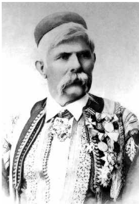
Marko Miljanov (1833-1901)

su tri srbo-crnogorska, a tri albanska. Nekoliko decenija nakon njega istu tradiciju zabeležio je, ali među Crnogorcima, srpski putopisac Spiridon Gopčević. Od kraja XIX veka, kako se čini, i među Crnogorcima i među Albancima sve je popularnija tradicija o petoricu braće – Vasu, Krasu, Ozru, Pipu i Otu, rodonačelnicima plemena Vasojevići, Krasnići, OZRINIĆI, Piperi i Oti (tri crnogorska i dva albanska plemena). Ovome treba dodati i predanja o zajedničkom albansko-srpskom poreklu Kuča, kao i brojnih drugih crnogorskih i severnoalbanskih bratstava. Ukratko, iako tačan broj i imena braće i plemena variraju u različitim izvorima, van sumnje je da je znatan broj crnogorskih i albanskih plemena negovao predanje o svom zajedničkom poreklu od istog pretka i druge tradicije o međusobnom krvnom srodstvu.